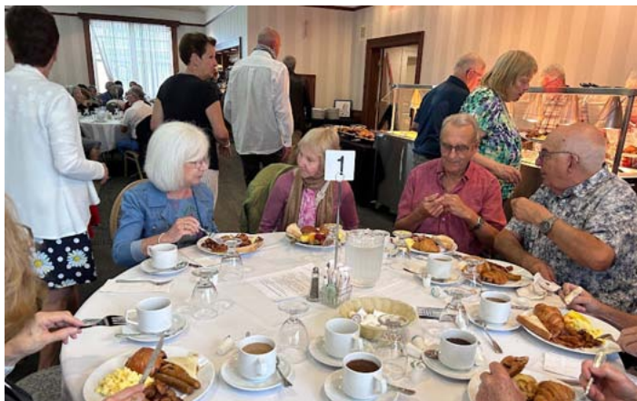
Les discussions allaient bon train autour des tables.

Le matin du 12 septembre 2024, les abords du Manoir Montmorency ont résonné de joie et de retrouvailles. Ce jour-là, 117 personnes étaient réunies pour partager le traditionnel déjeuner des personnes retraitées, marquant ainsi une nouvelle édition de cet événement annuel très attendu.