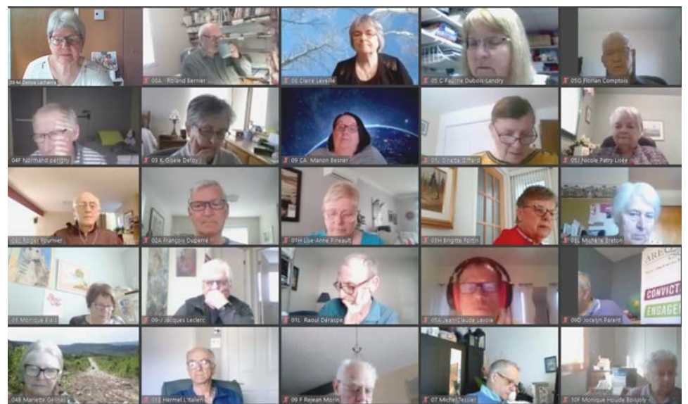
Le Conseil national en vidéoconférence par Zoom, le 23 mars 2021.

Tombée des articles et envoi du bulletin Juin 2021