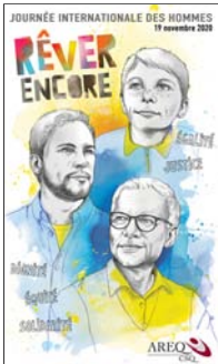
Affiche conçue par Paule Thibault, artiste et illustratrice de la région de Québec.